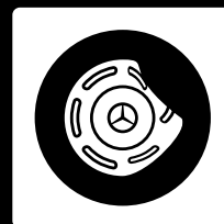
Dommages massifs aux jantes 2