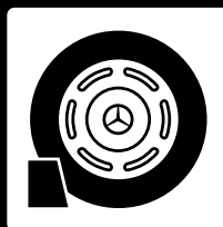
Dommages liés à l'utilisation